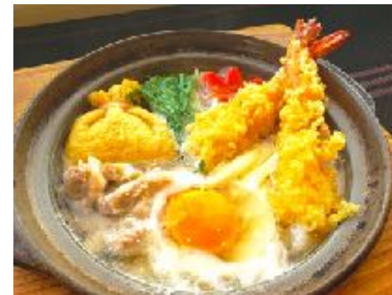
鯛だし鍋焼き塩うどん定食 (ご飯、漬物) 1273円 (1400円)