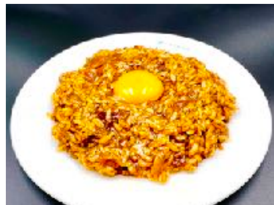
こく旨 混ぜハヤシ 1164円 (1280円) ミニサラダ プラス220円