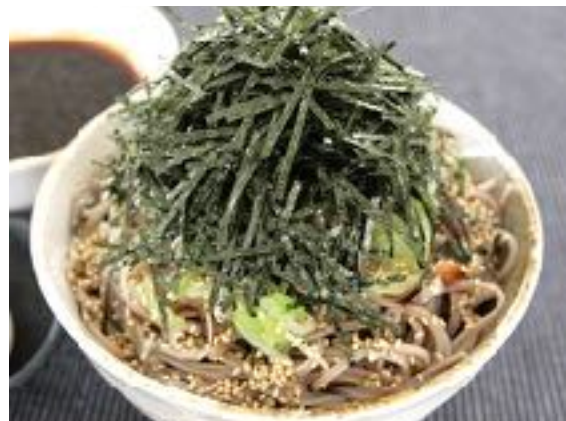
ラー油肉そば (冷) 1091円 (1200円) ラー油肉うどん (冷) 1091円 (1200円) セット ご飯・漬物 +230円 セット 黄身醤油漬けご飯・漬物+350円