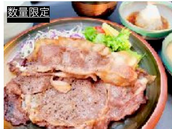
数量限定 国産牛リブロース一枚肉定食 2000円 (2200円) (とろろ、味噌汁、ご飯、漬物)