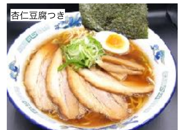
杏仁豆腐つき 煮干し醤油チャーシュー麺 1255円 (1,380円) 煮干し醤油らー麺 982円 (1080円) セット ご飯・漬物 +230円 セット 黄身醤油漬けご飯・漬物+350円