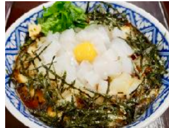
名物 いか丼 1273円 (1400円) (味噌汁・漬物)