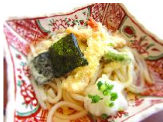
天おろしそば/天おろしうどん(温・冷) 1256円 (1380円) セット ご飯・漬物 +230円 セット 黄身醤油漬けご飯・漬物+350円