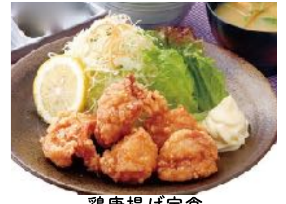
鶏唐揚げ定食 ~和風梅ダレと特製にんにくダレ~ 1110円 (1220円) (味噌汁・漬物・杏仁豆腐)