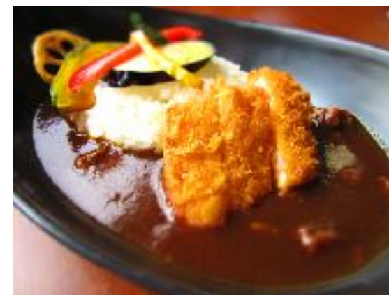
こだわりビーフカレー 1091円 (1200円) 厚切り豚かつカレー 1528円 (1680円) ミニサラダ プラス220円