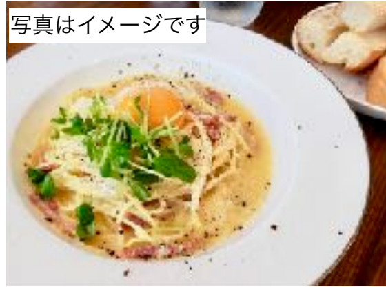
本日のパスタランチ 1300~1800円 (ガーリックトースト・サラダ)