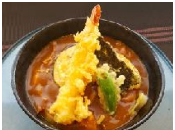
天カレーうどん 1182円 (1300円) セット ご飯・漬物 +230円 セット 黄身醤油漬けご飯・漬物+350円